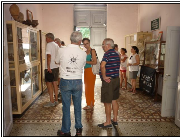
Visita de Integrantes del grupo de jazz argentino "Santa Rosa" que participó del 8º encuentro internacional de "Jazz a la calle" realizado en enero del corriente año