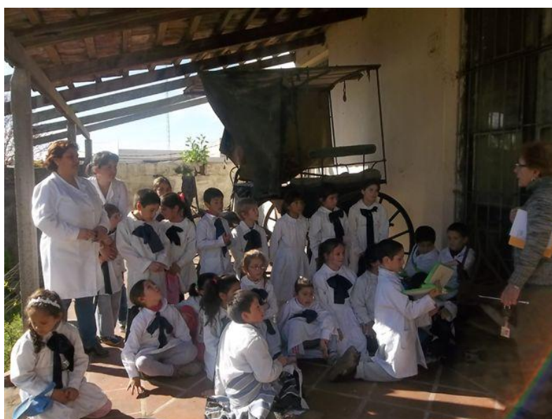
Visita del grupo de 2º año de la Escuela Nº 10